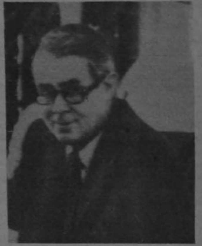
Cyrus Vance ...ahora contra él...

Vance iniciará hoy en gira de siete días por el Medio Oriente, destinada a lograr la reanudación de las conversaciones de paz de 1973 en Ginebra. Tiene prevista una breve escala el viernes en Beirut en viaje de El Cairo a Amman, Jordania. (Pasa a la página 16)