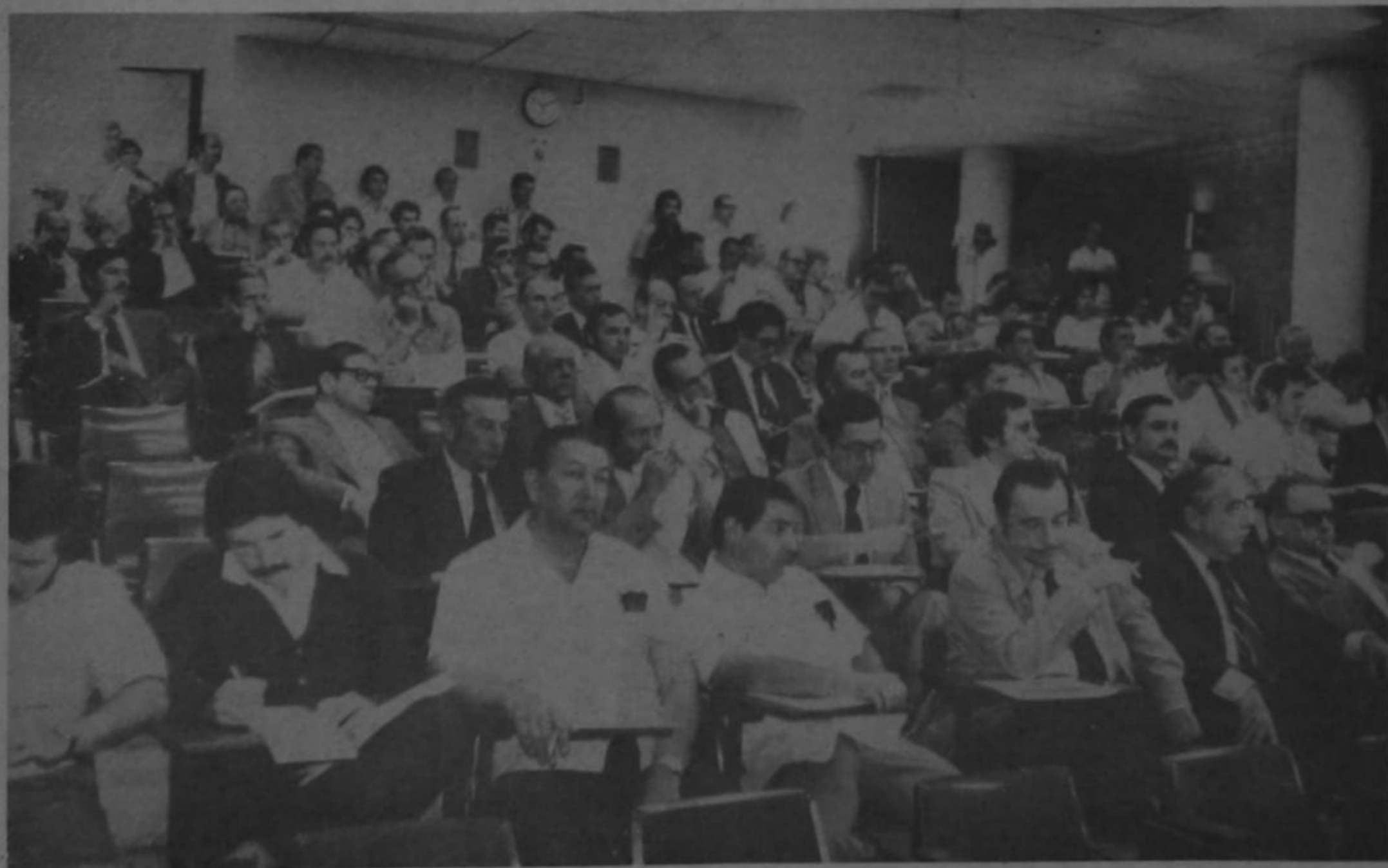
El Congreso Nacional Cafetalero, que durante seis años consecutivos se ha venido celebrando para analizar la problemática de esa actividad, despertó cada vez mayor

Se le pide que adopte sistemas que favorezcan preferentemente al pequeño productor de café, y dentro de ese pensamiento proceda a una revisión general en cuanto a la financiación cafetalera, con el propósito de que dicha financiación se ajuste a los niveles de costos de producción.