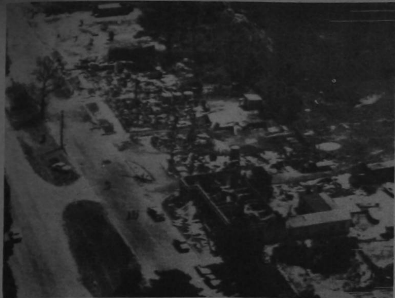
La principal calle de Streattham, Australia, está repleta de escombros de edificios destruidos por un incendio que destruyó 15 de ellos. Los incendios dejaron un saldo de por lo menos cinco personas y millones de animales de granja muertos en todo el estado de Victoria.