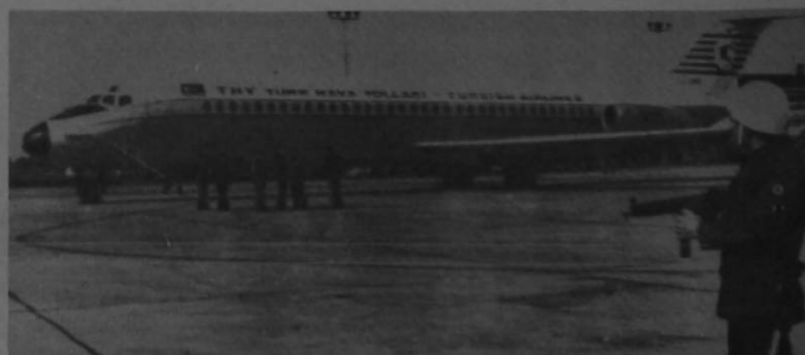
DC-9 de la Aerolínea Turca custodiado por la policía en el aeropuerto militar de Esmirna, Turquía, luego que un cadete policial de 17 años fracasó en un intento de secuestrarlo.

La agencia turca Anatolia informó que el hombre disparó también contra las fuerzas de seguridad que rodearon al aparato, pero Mentese dijo que las únicas personas heridas son el piloto y la azafata.