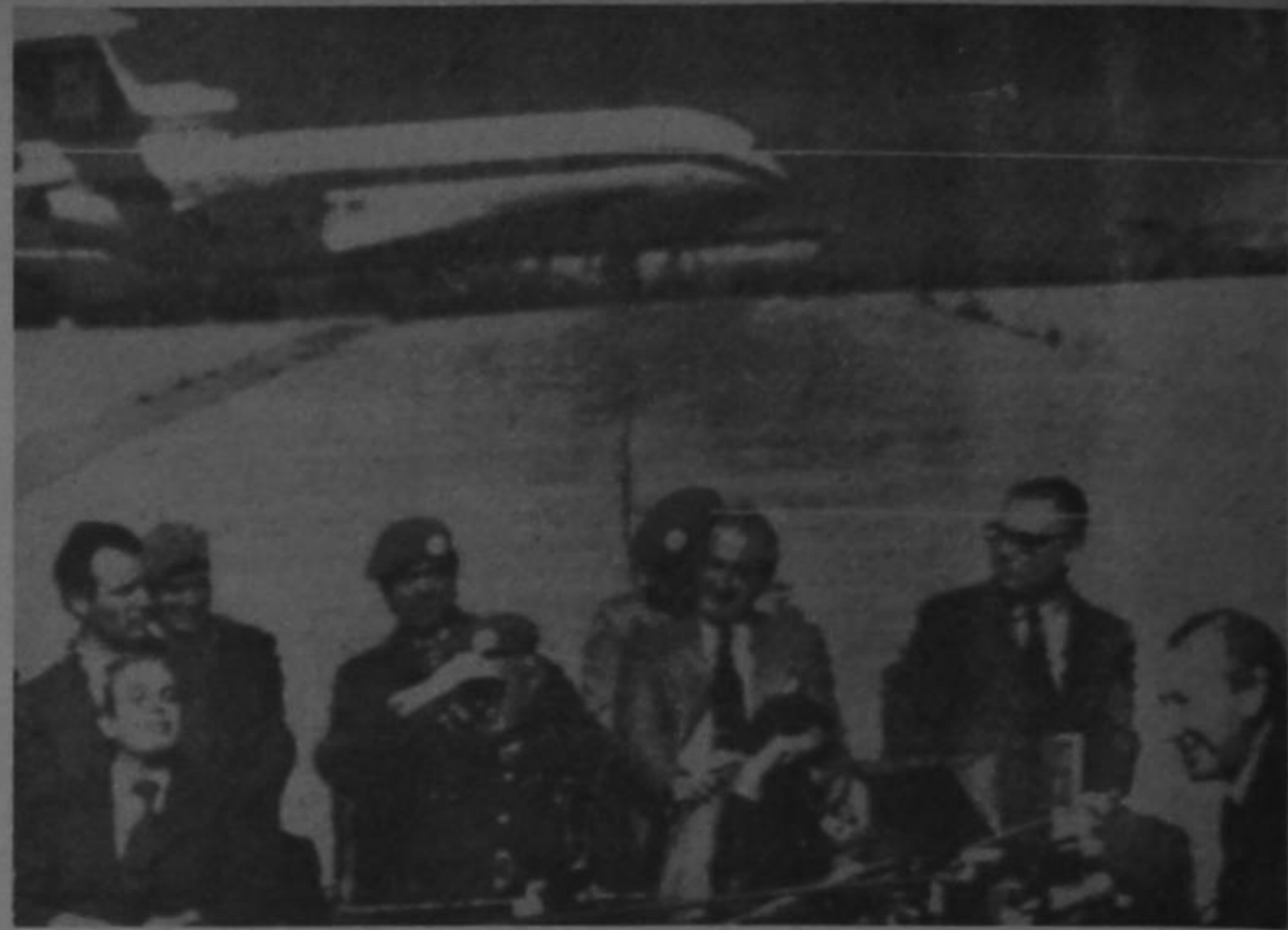
El Secretario General de las Naciones Unidas, Kurt Waldheim, sentado a la derecha, concede una rueda de prensa al aire libre en el aeropuerto de Nicosia, Chipre. Waldheim pasó el día paseando por la isla. En el fondo se ve un avión de la Cyprus Airways, varado en el aeropuerto desde que los turcos lo tomaron en 1974.

No pudo establecerse contacto con funcionarios del secretariado de la OPEP en Viena para obtener comentarios acerca de las sesiones a puerta cerrada, que durarán según observadores una semana.