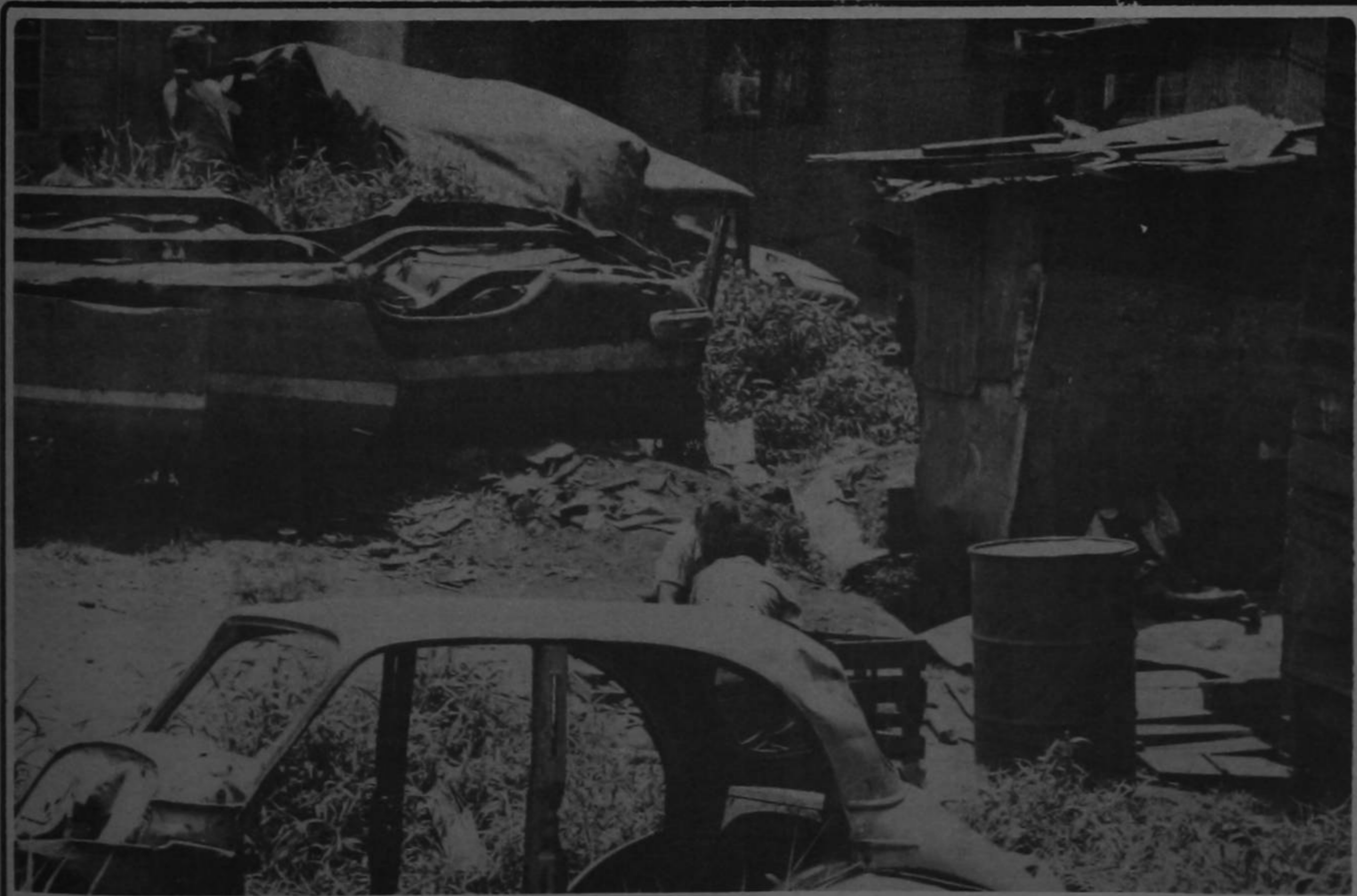
El corazón mismo de la ciudad capital se está convirtiendo en un basurero. En este sector se tiran carros viejos, estañones, láminas de hierro galvanizado y desperdicios. Lugares como éste hay en Tournón, en barrio

El IFAM otorgará créditos hasta del noventa por ciento para costear los proyectos municipales y cobrará un interés del ocho por ciento anual sobre los saldos. Este último tipo de interés podrá ser cambiado por la Junta Directiva del IFAM.